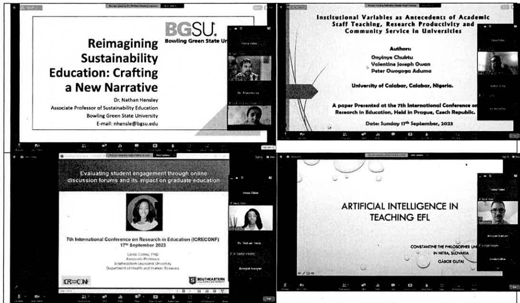
ภาพที่ 2 บรรยากาศการนำเสนอแบบ Virtual