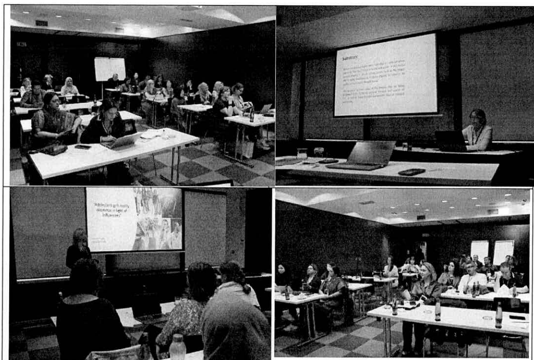
ภาพที่ 1 บรรยากาศการนำเสนอแบบ Onsite

https://www.icreconf.org/7th-round-prague/