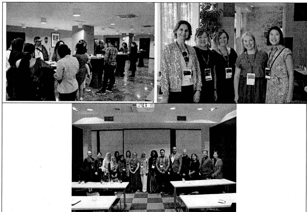
ภาพที่ 3 บรรยากาศการแลกเปลี่ยนประสบการณ์ของผู้เข้าร่วมประชุม