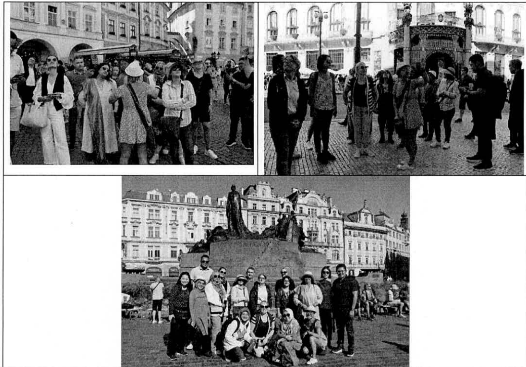
ภาพที่ 4 บรรยากาศการศึกษาดูงานนอกสถานที่