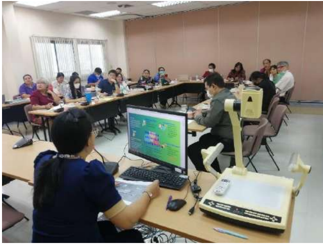
ภาพกิจกรรมการแลกเปลี่ยนเรียนรู้ฯ ณ วันที่ 5 มีนาคม 2567 ณ ห้องประชุม 2604