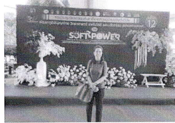
ภาพการเข้าร่วมการประชุมวิชาการระดับชาติราชภัฏหมู่บ้านจอมบึงวิจัย ครั้งที่ 12