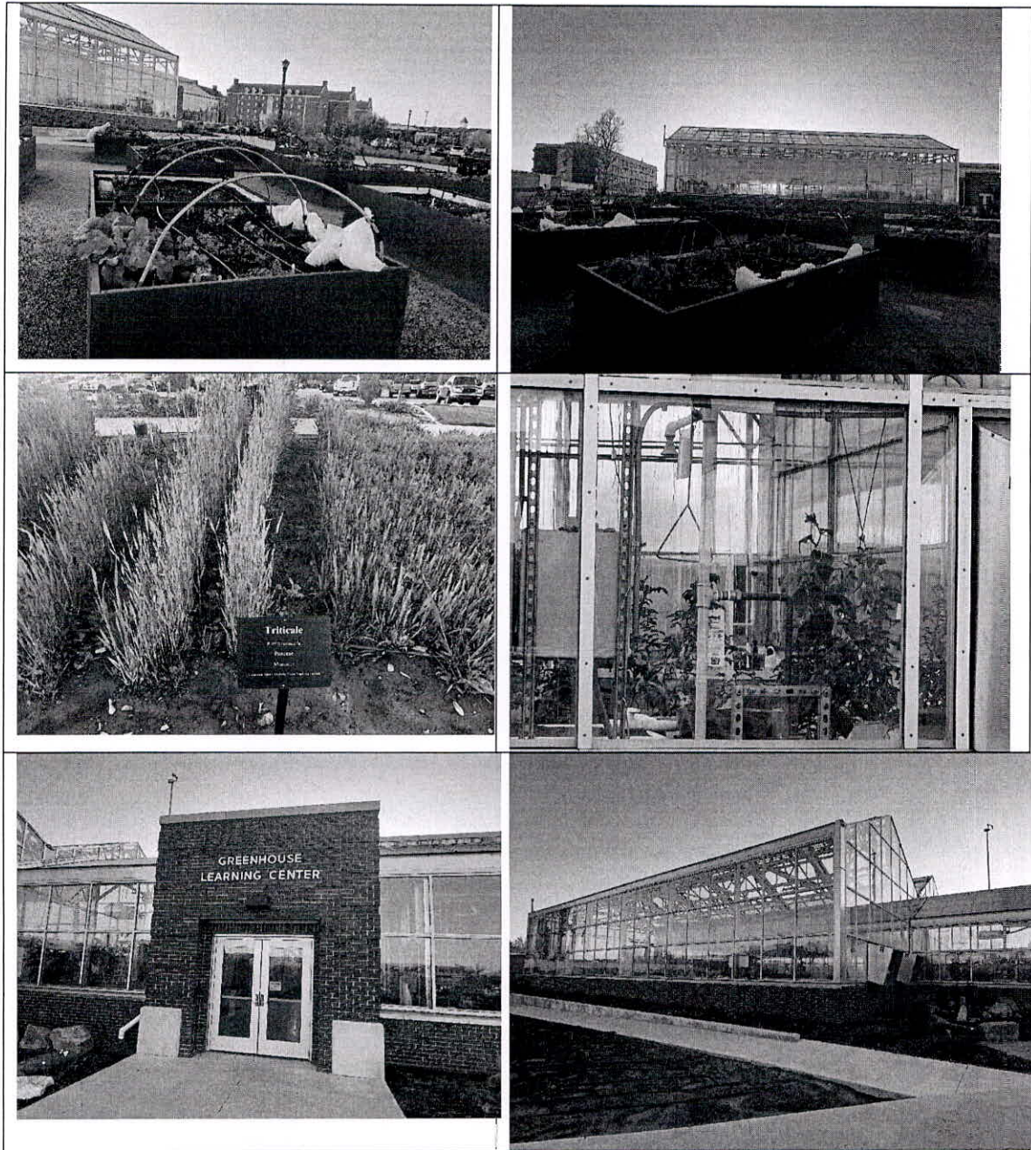
ภาพที่ 3 บรรยากาศการศึกษาดูงาน