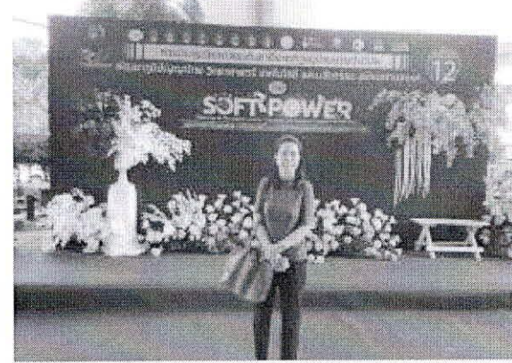
ภาพการเข้าร่วมการประชุมวิชาการระดับชาติราชภัฏหมู่บ้านจอมบึงวิจัย ครั้งที่ 12