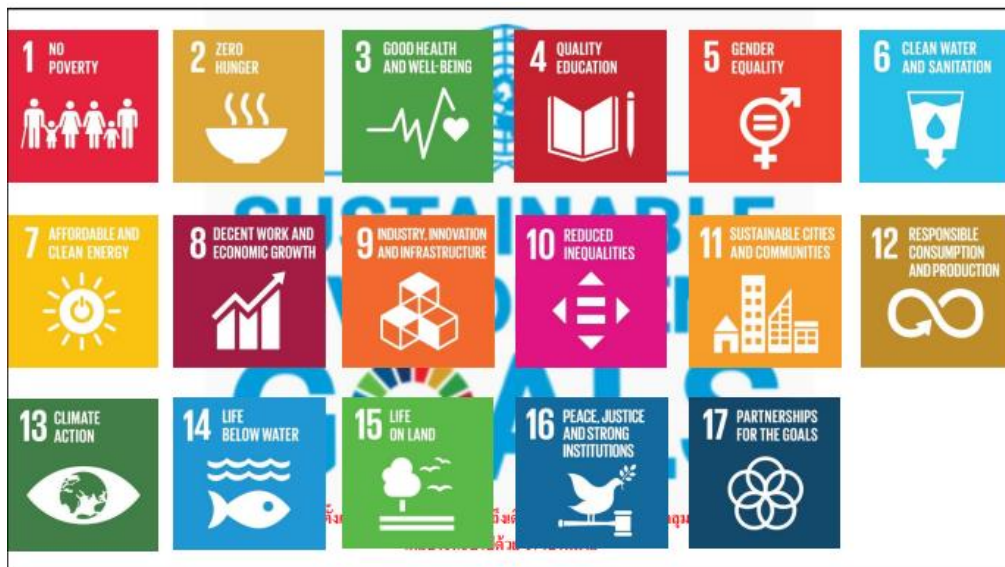
17 เป้าหมายหลัก ศาสตร์เศรษฐกิจพอเพียง

มหาวิทยาลัยเทคโนโลยีพระจอมเกล้าพระนครเหนือ จึงได้น้อมนำศาสตร์พระราชชาของในหลวงรัชกาลที่ 9 มาใช้เพื่อพัฒนามหาวิทยาลัยสู่ความยั่งยืน และเป็นการบรรลุสู่เป้าหมายการพัฒนาที่ยั่งยืน หรือ Sustainable Development Goals (SDGs) ขององค์การสหประชาชาติ ทั้ง 17 เป้าหมาย โดยมีเจตนารมณ์ประสานความร่วมมือระหว่างชุมชนโดยรอบมหาวิทยาลัย รวมถึงสถาบันทางศาสนา กับภาคส่วนงานอื่นๆ ทั้งภาครัฐ เอกชน และประชาสังคม ให้เกิดพลังในการฟื้นฟู เสริมสร้างทรัพยากรธรรมชาติป่าไม้และสิ่งแวดล้อมของโลกที่กำลังเกิดปัญหาวิกฤตและเกิดการเปลี่ยนแปลงอย่างรวดเร็ว มหาวิทยาลัยจึงเปรียบเสมือน บ้าน วัด และโรงเรียน คือ บวรสถานที่อันประเสริฐหรือล้ำเลิศ สำหรับการบ่มเพาะอบรมเด็กและเยาวชนในอนาคต นอกจากนี้มีโครงการอีกหลายโครงการที่มหาวิทยาลัยทำประโยชน์ในด้านการเรียนรู้วิธีการอนุรักษ์สิ่งแวดล้อมและพลังงานทดแทนให้กับหน่วยงานภายนอกหลายแห่งทั่วประเทศ นอกจากจะเป็นตัวอย่างในการสร้างความมั่นคงให้กับประเทศไทยแล้วยังเป็นการสร้างความมั่นคงให้กับโลก ตรงตามเป้าหมายการพัฒนาอย่างยั่งยืนขององค์การสหประชาชาติ หรือ ตอบโจทย์ SDGs ได้อีกด้วย